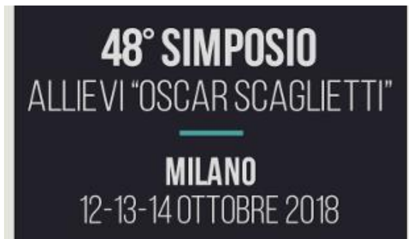
Il manifesto del 48° simposio Allievi di Scaglietti

Il simposio degli allievi nel 2018 si è svolto a Milano dal 12 al 14 ottobre.