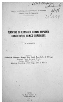
Il frontespizio di una pubblicazione di Scaglietti sulla chirurgia della mano.

della SICM: «La Società è nata perché è stata sentita da un gruppo di cultori la necessità di incontrarsi e discutere particolari problemi che interessano questo campo della chirurgia che, si deve riconoscere, fino ad oggi in Italia non è stato considerato nella giusta luce, nella sua importanza, in quanto le statistiche dimostrano che le lesioni della mano risultano le più frequenti sia nel campo professionale sia nel campo della vita normale e forse anche nell'infortunistica stradale.» ( Oscar Scaglietti, Firenze 4 Novembre 1963 ).