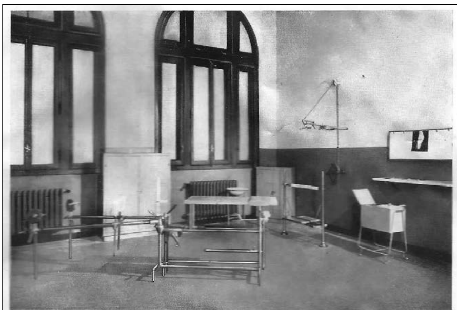
Fig. 234 – Sala per la confezione degli apparecchi gessati: in primo piano il tavolo di Scaglietti ed in fondo a destra l'apparecchio di Delitala.

Il tavolo di Scaglietti. Immagine tratta dal libro “Fratture e lussazioni”. Frammenti di questo volume, tra cui la foto, sono stati ritrovati tra le macerie della demolizione di Villa Salus avvenuta nel luglio 2018.