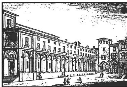
Annuario diplomati dal 1860 ad oggi