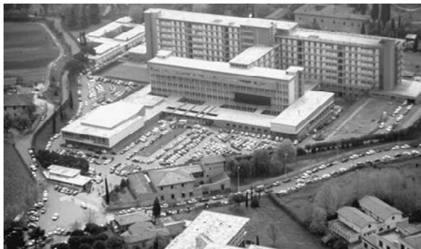
A sinistra Villa Salus, a destra il CTO di Firenze.