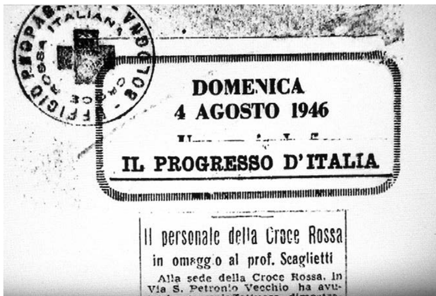
Onorificenza assegnata a Scaglietti dalla Croce Rossa per i suoi meriti in tempo di guerra.

sostituirlo alla guida del Centro Putti, ma tornandovi ogni settimana fino al 1951, quando il Putti cessò ogni attività.